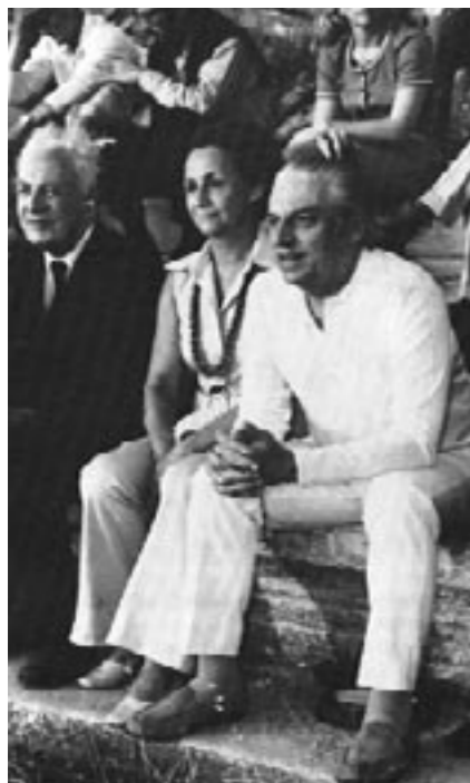
Ο Κωνσταντίνος και η Έμμα Δοξιάδη με τον Arnold Toynbee στο αρχαίο θέατρο της Δήλου το 1970, κατά τη διάρκεια του 8ου Συμποσίου της Δήλου