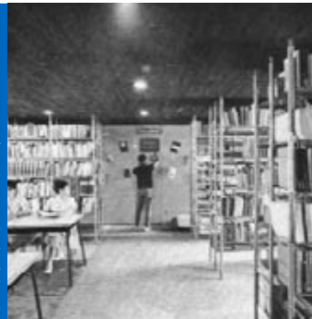
Η βιβλιοθήκη του ΑΚΟ της οδού Στρατηγικού Συνόρισμου 24, στις αρχές της δεκαετίας του 1960

τη γραμματεία της Παγκόσμιας Εταιρείας Οικιστικής (World Society of Ekistics), που ιδρύθηκε το 1967. Βασική δραστηριότητα του ΑΚΟ αποτελούσε η συλλογή, ταξινόμηση και διάδοση της πληροφορίας σχετικά με την επιστήμη της οικιστικής. Για το σκοπό αυτό εξέδιδε το περιοδικό Ekistics , το Ekistic Index of Periodicals , διάφορα δελτία και μονογραφίες. Στα πλαίσια αυτής της συστηματικής προσπάθειας τεκμηρίωσης συγκροτήθηκε και η σημαντική σε έκταση βιβλιοθήκη, η οποία είναι πιθανόν και η πρώτη επιστημονική βιβλιοθήκη στην Ελλάδα που οργανώθηκε σύμφωνα με τις σύγχρονες αρχές της βιβλιοθηκονομίας.